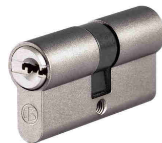
Moonlight Silver C670